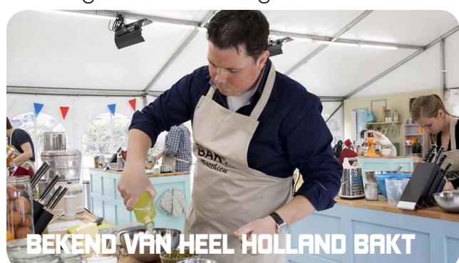
BEKEND VAN HEEL HOLLAND BAKT

Naast de koolhydraten vragen de spieren ook om eiwitten. Daar zorgt onze Brabantse Bourgondiër voor. Er wordt op wereldniveau voor u gebakken. De organisatie heeft zich